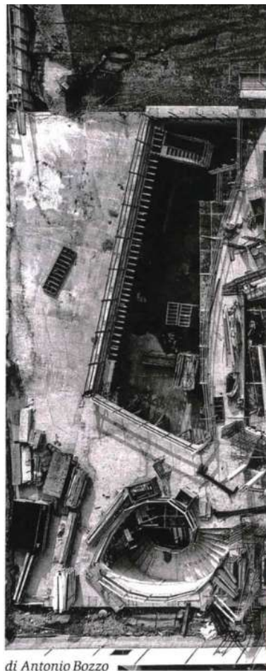
di Antonio Bozzo