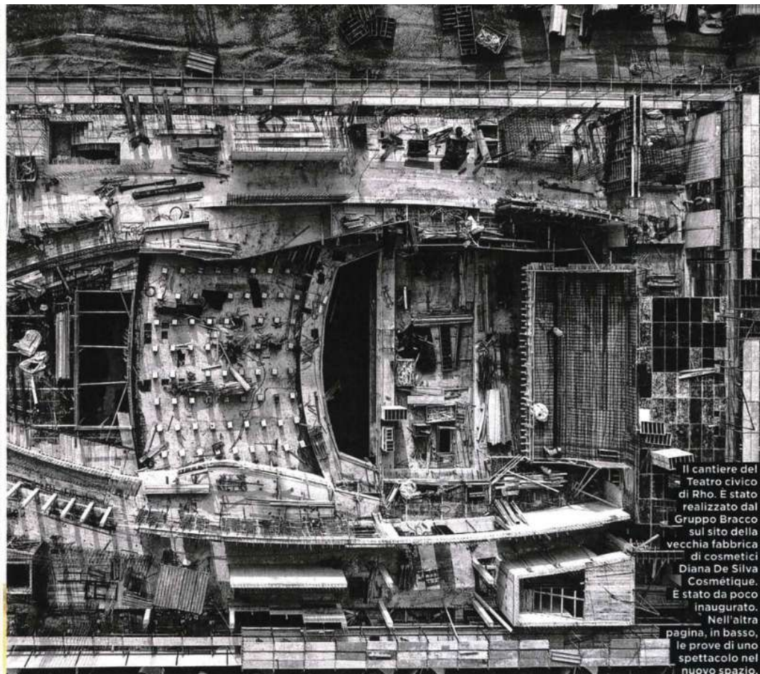
Il cantiere del Teatro civico di Rho. È stato realizzato dal Gruppo Bracco sul sito della vecchia fabbrica di cosmetici Diana De Silva Cosmétique. È stato da poco inaugurato. Nell'altra pagina, in basso, le prove di uno spettacolo nel nuovo spazio.

F u forse Milano. Ritratti di fabbriche , libro del fotografo e architetto Gabriele Basilico uscito nel 1981, a sensibilizzare gli italiani più avvertiti sulla necessità di conservare - nel caso far risorgere, cambiandone uso e destinazione - i siti di stabilimenti abbandonati, un tempo pulsanti di fervore industriale. Da allora, molto è cambiato. L'Italia, Paese manifatturiero e di indubbia inventiva, pullula di realtà culturali e museali sorte su ex fabbriche, talvolta inglobate nel nuovo progetto, spesso solo ricordate con immagini, schede e video.